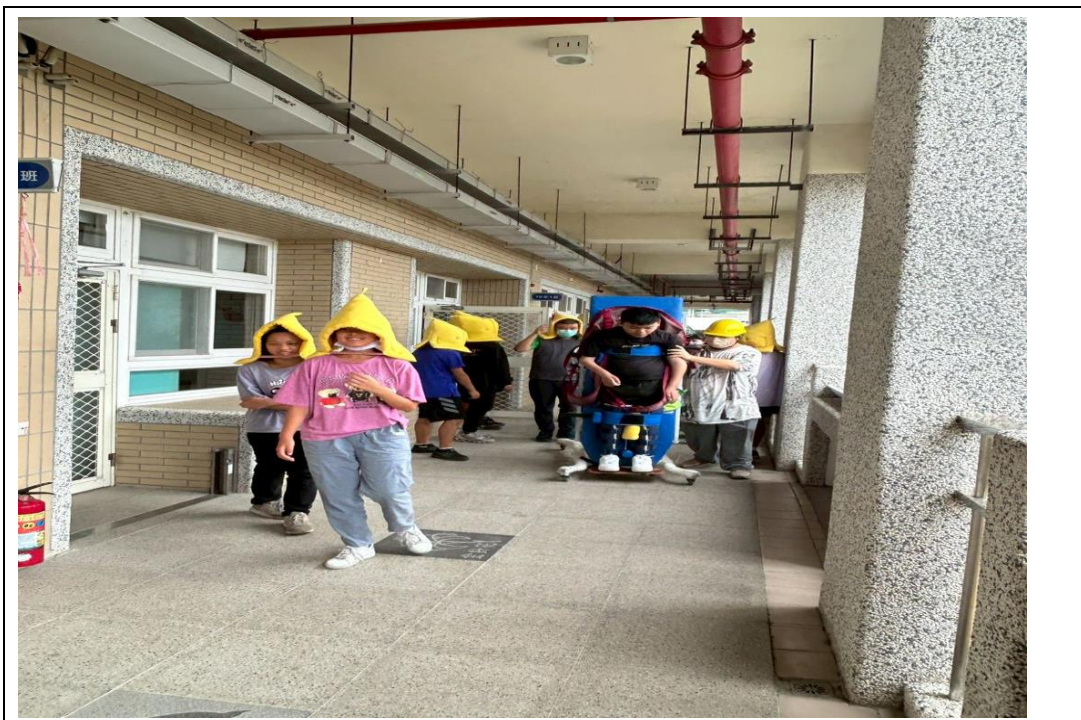
說明：進行避難疏散。