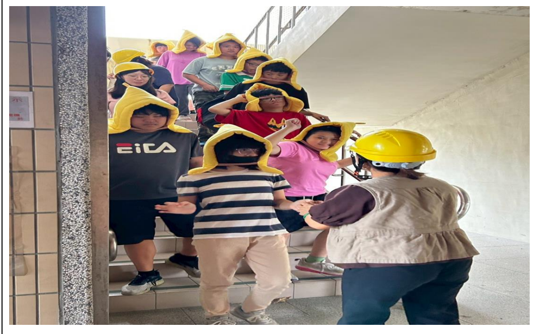
說明：進行避難疏散。