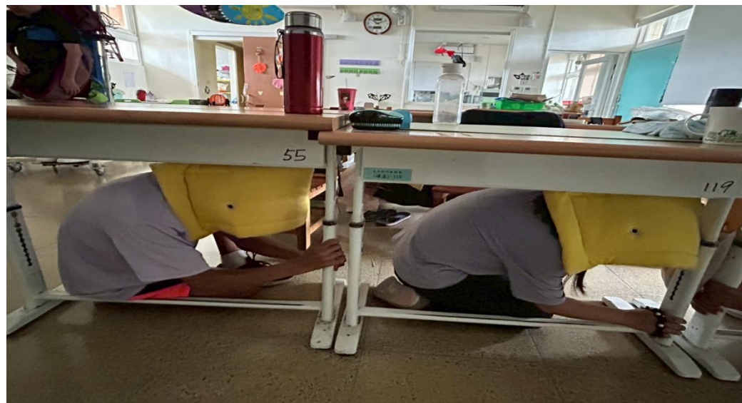
說明：教室內避難掩護。