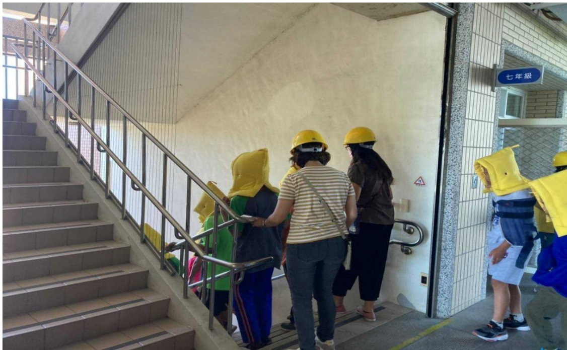
說明：進行避難疏散