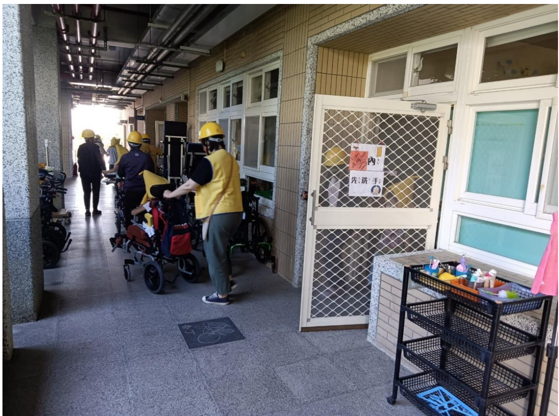
說明：進行避難疏散。