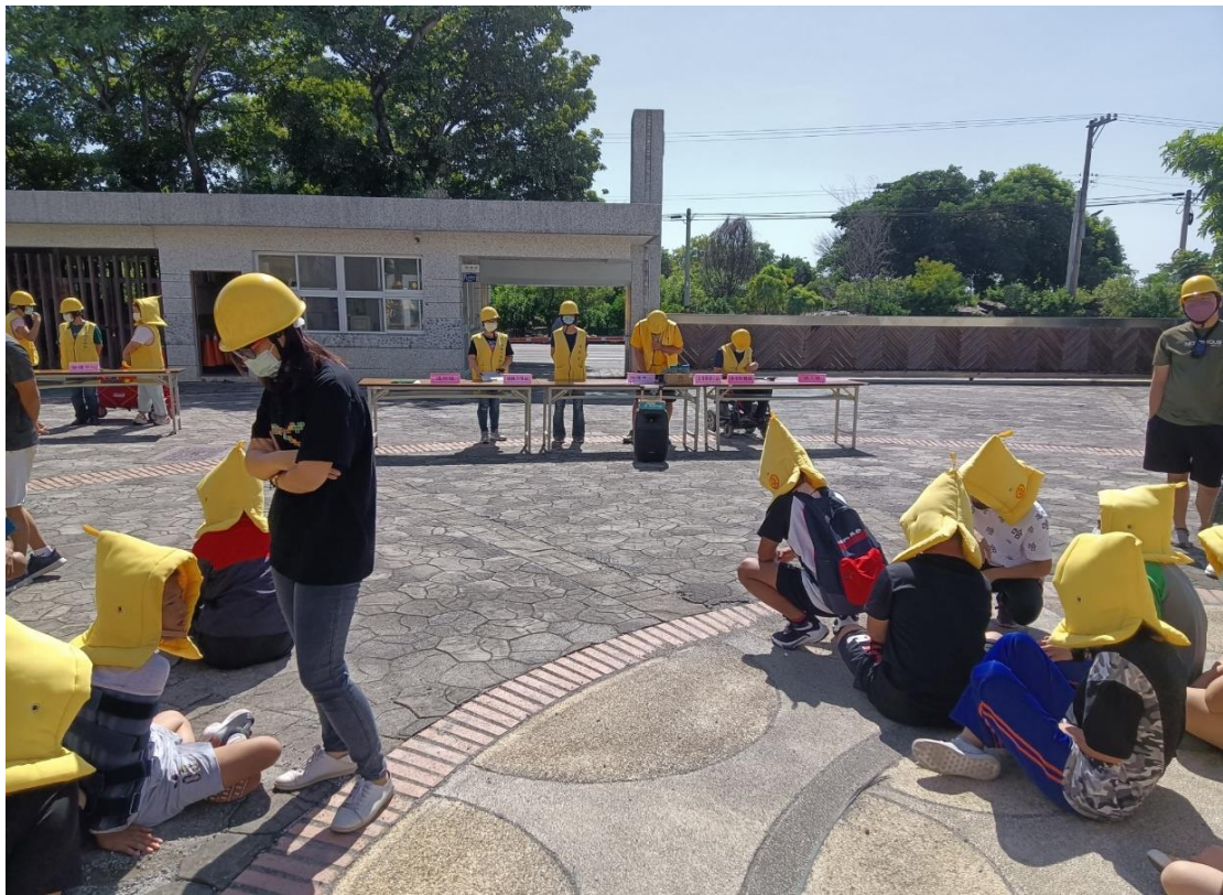
說明:至安全地點集合