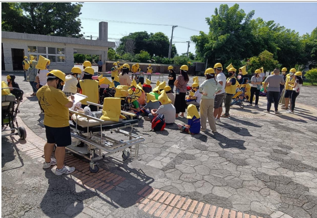
說明:至安全地點集合