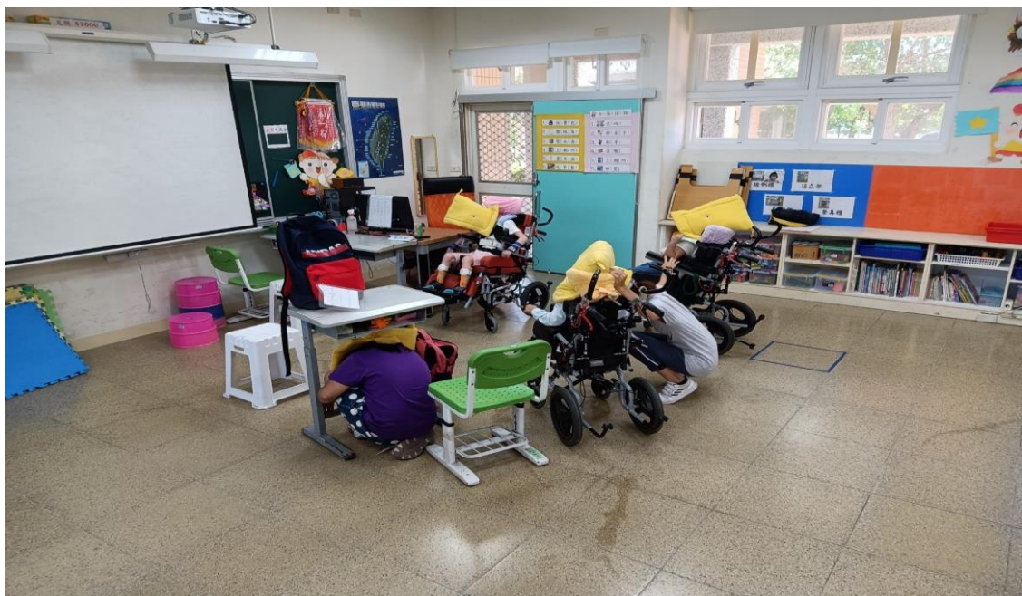
說明：教室內避難掩護。