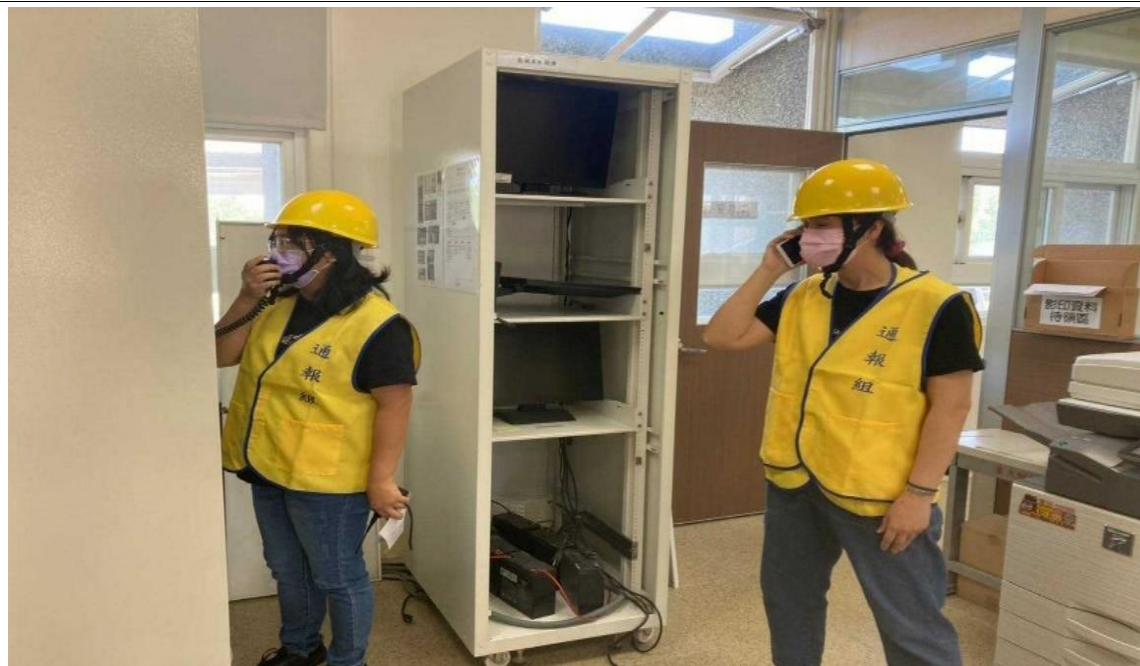
說明:通報班進行緊急廣播及通報。