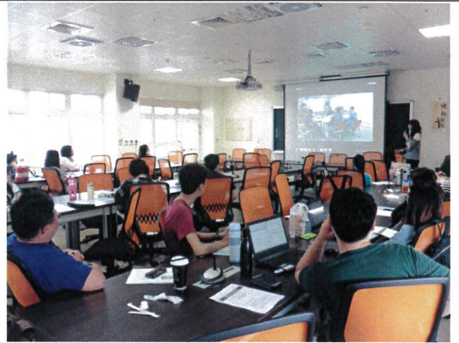
透過情境設計讓學生學習防範詐騙之技巧