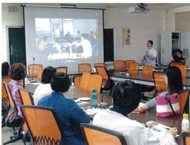
以學長姐職場實習影片引導學生規劃職涯