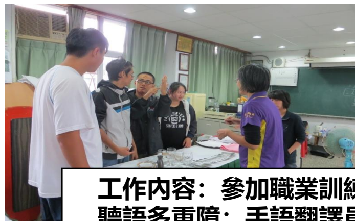
工作内容：參加職業訓練 聽語多重障：手語翻譯員