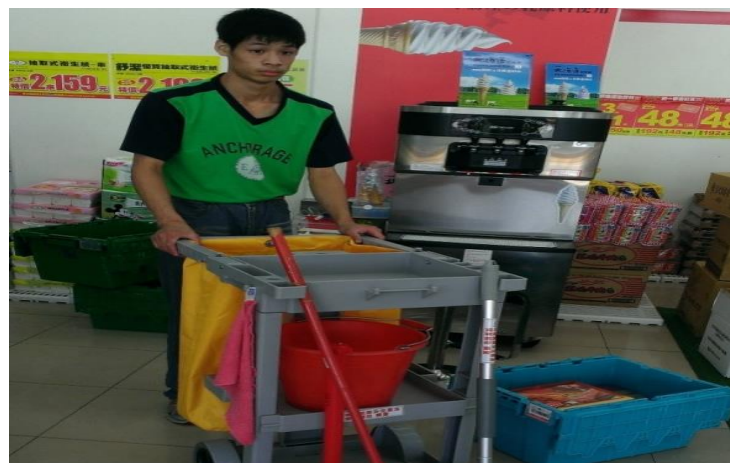
工作内容：清潔、擺貨 智能障礙：清潔手推車、長柄清潔工