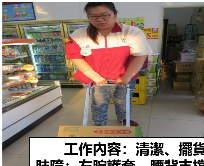
工作内容：清潔、擺貨 肢障：左腕護套、腰背支撐帶、二輪伸縮鉛車