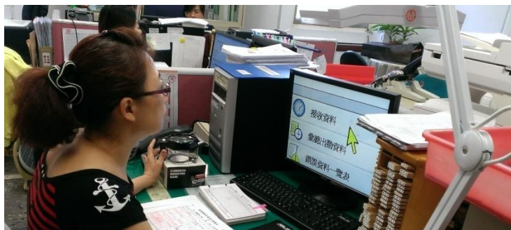
工作内容：行政文書 視障：電腦擴視軟體、放大鏡