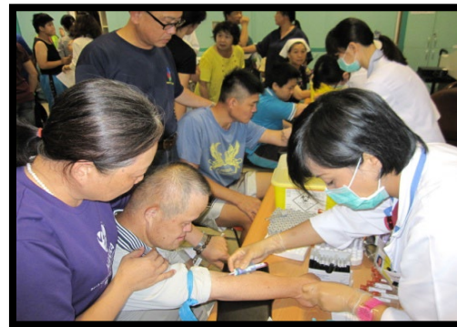
臨時性之陪同就醫