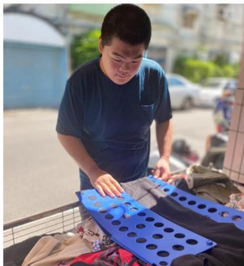
二手商品分類及整理